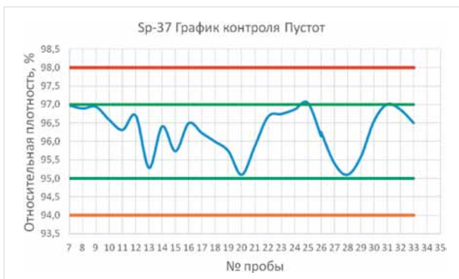
Рис. 5. Пример графика контроля содержания пустот через относительную плотность при выпуске асфальтобетонной смеси

Гиратор – это один из самых важных приборов в системе объемно-функционального проектирования. Без него не осуществить подбор состава асфальтобетона и не выполнить операционный контроль качества. В процессе уплотнения на гираторе определяется геометрическая плотность образца, которая имеет хорошую корреляцию с фактической плотностью,