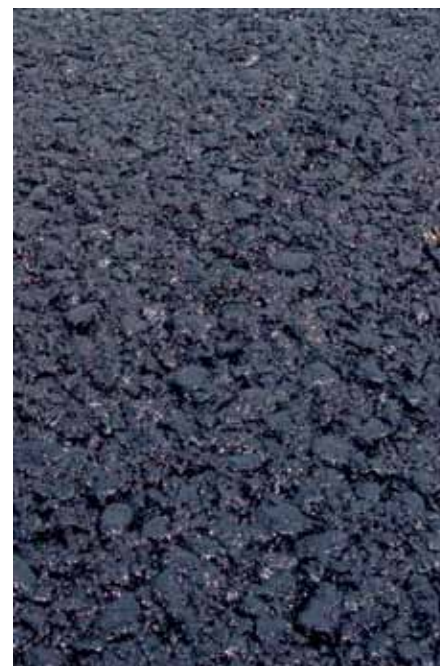
Рис. 1. Структура кернов и поверхности асфальтобетонной смеси SP-37

марку PG. В нашем случае битумное вяжущее для производства асфальтобетонной смеси для трассы «Таврида» отгружалось с терминала, имеющего полностью оборудованную и аккредитованную лабораторию, которая проводит контроль качества при производстве PG вяжущих, отбор проб и испытания с паспортизацией каждой партии выпускаемой продукции.