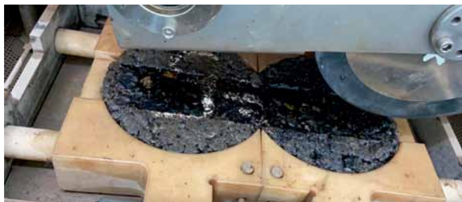
Рис. 4. Испытание верхнего слоя покрытия из ЩМА-19