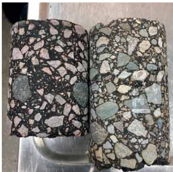
Рис. 3. Сравнение структуры асфальтобетонов по кернам (слева – крупнозернистый плотный тип А, справа – SP-37)

Проведение испытаний по определению как стандартных, так и нестандартных показателей свойств асфальтобетона позволяет нам сделать наилучший выбор и