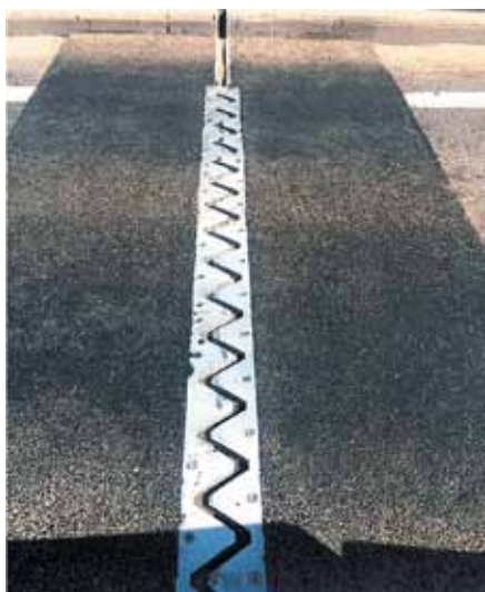
Деформационный шов ОП ДШ 100 ПГ

шения плавности проезда на мостовых сооружениях в населенных пунктах и находящихся на расстоянии менее 2 км от них, а также на автодорогах с разрешенной скоростью движения автотранспорта более 90 км/ч рекомендуется в конструкциях деформационных швов применять дополнительные элементы перекрытия, предотвращающие попадание колеса в зазор и исключают удар о нижерасположенные конструкции.