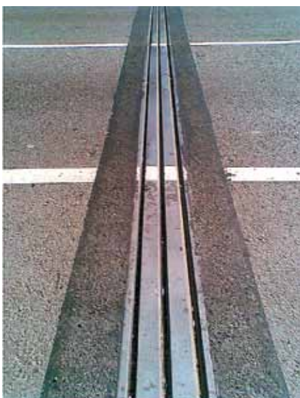
Переходная зона ПУГМК (VJ VAUM)

Эффективным решением данной проблемы является