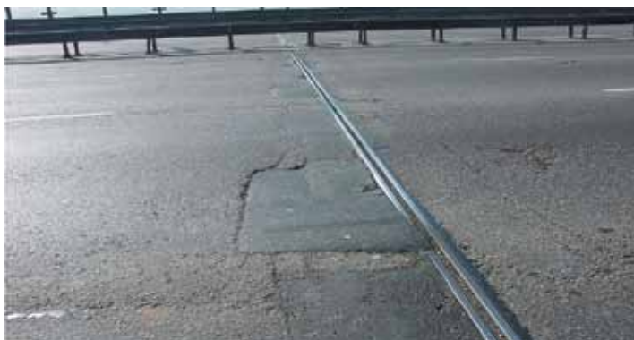
Характерные разрушения примыкания к деформационному шву

После начала разрушения зоны примыкания требуются постоянные оперативные дорогостоящие мероприятия по содержанию конструкции ДШ в нормативном состоянии (устранение разрушений примыкания дорожной одежды к конструкции ДШ), эффект от которых носит временный характер.