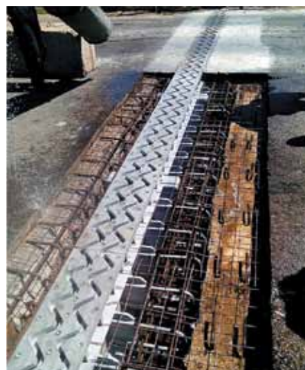
Деформационный шов МП ДШ 160 ПГ

Учитывая требование СП 35.13330.2011 по минимальным толщинам асфальтобетонного покрытия, необходимая высота окаймления деформационного шва (с учетом толщины гидрои-