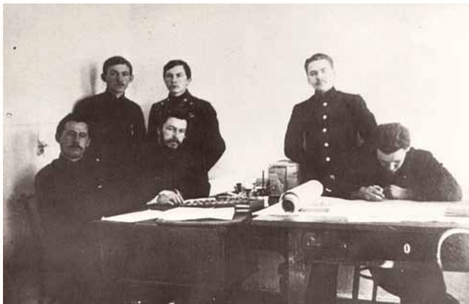
Камеральная обработка экспедиционных материалов

В 1916 году планировалось построить железную дорогу до Семипалатинска с веткой на Бийск. Чуйский тракт в этом случае становился транспортным путем для товаров из Монголии на запад России. Бийская газета «Алтай» от 9 марта 1913 года сообщала: «Для обследования Чуйского тракта нынешним летом предполагается командировать особую партию от Министерства путей сообщения, на что ассигновано 15 тысяч рублей. Во главе партии, по всей вероятности, станет старший техник путей сообщения В.Я. Шишков, производивший исследования бассейнов реки Бии и Нижней Тунгуски на севере Сибири». Есть еще одна выдержка из той же газеты, но уже за другое число: «По распоряжению Министерства путей сообщения в текущем году организована партия для исследования Чуйского тракта с целью выяснения всех его дефектов. В настоящее время там ведутся работы изыскательской партии Томского округа путей сообщения. Работы второй группы начались постановкой полевого пикета на левом берегу реки Бии у пристани Бийского городского перевоза. В селе Алтайском нивелировка связана с астрономическим пунктом, работы первой группы начались от Кош-Агача. С 3 июля работы открылись в полном составе при достаточном числе техников, рабочих и геодезических инструментов».