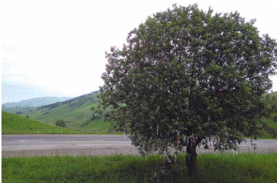
Современный чуйский кряж (Алтай)