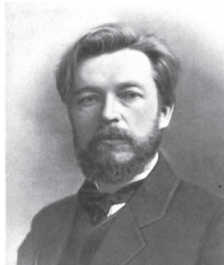
Из биографии В.Я. Шишкова (1873–1945):

Изыскания 1913–1914 годов кредитовали за счет средств, отпущенных на изыскания Сибирской железной дороги.