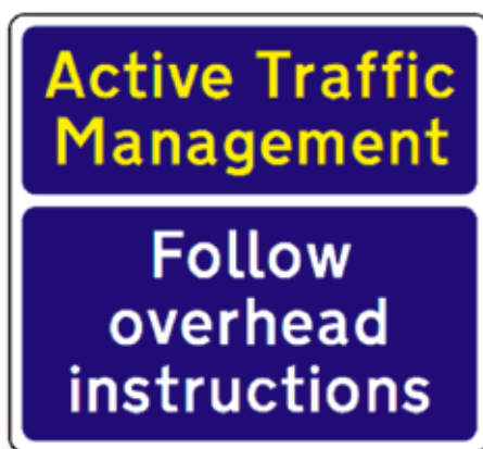
Рис. 1. Дорожный знак «Активное управление движением» («Active Traffic Management», Англия). Под активным управлением понимается совместное использование временных ограничений скорости, разрешения движения по обочине и светофорного регулирования на рампах развязок

В российской специальной литературе и периодике практически отсутствует информация о стремительно развивающемся в последнее десятилетие «активном управлении движением» (рис. 1). Из множества задач в составе «активного управления движением» особо выделяют прогнозирование и предотвращение заторов, эффективное использование пропускной способности магистральных дорог. В США быстро оценили перспективы европейской инновации, и в середине прошлого десятилетия в Европу был «высажен десант» для изучения