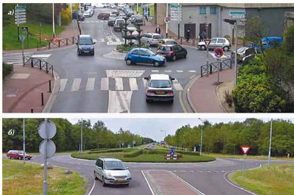
Рис. 3. В европейской практике организации движения широко применяются мини-кольца и компактные кольцевые пересечения: а – мини-кольцо около торгового центра города-спутника Парижа; б – компактное кольцо во внегородских условиях (Голландия)

За последние два десятилетия методики расчета средней задержки в разных странах (ФРГ, США, Канада) претерпели революционные изменения. Современная техника расчета задержек рассматривает разнообразные ситуации: наличие координированного и гибкого регулирования, растущий и убывающий затор на подходе к перекрестку. Эти методики используются и в пакетах программ, поступающих на российский рынок, на-